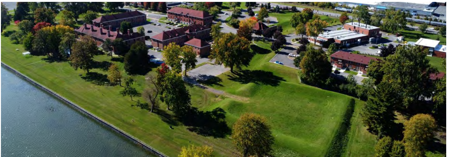
Fort Saint-Jean et la rivière Richelieu

Le corridor de la rivière Richelieu et du lac Champlain constitue depuis longtemps une zone de conflit et d'importance stratégique. En 1776, la retraite des troupes américaines du fort Saint-Jean et la consolidation subséquente du contrôle britannique sur la vallée du Richelieu ont marqué un moment décisif dans la lutte pour le territoire et le pouvoir. L'année 2026 coïncide avec le 250 e anniversaire de ces événements, offrant une occasion privilégiée de réfléchir à la résistance, à la présence militaire et aux traces matérielles qu'elles laissent derrière elles.