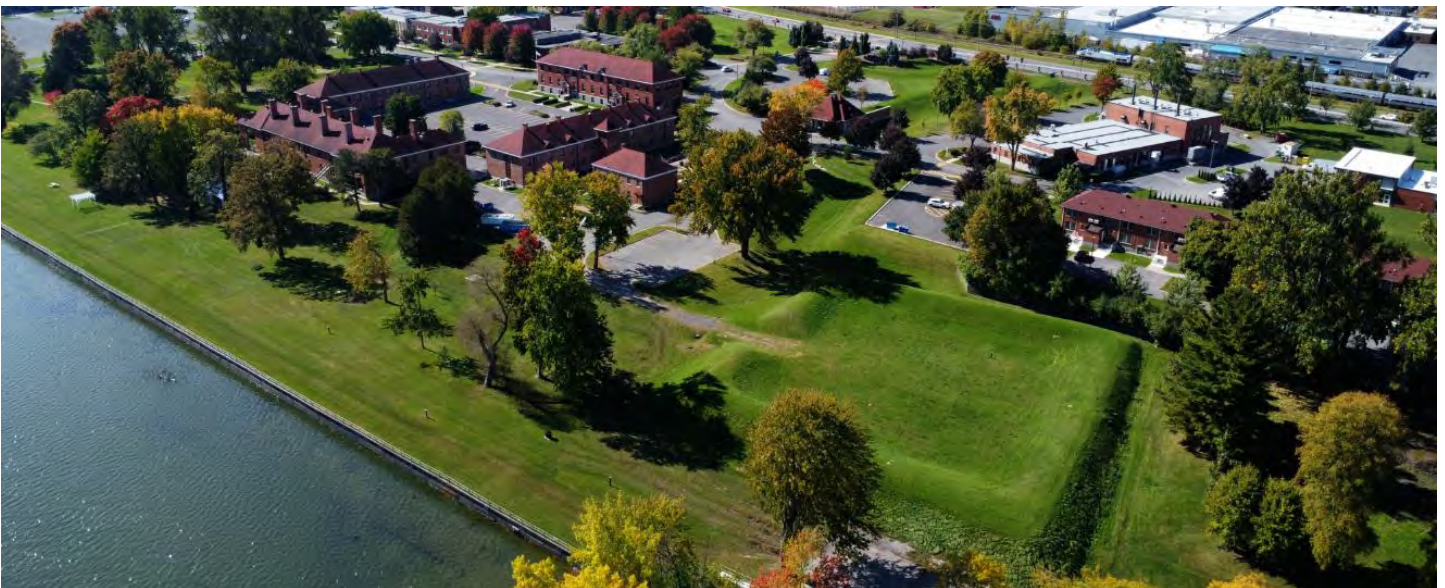
Fort Saint-Jean and the Richelieu river

The Richelieu River-Lake Champlain corridor has long been a zone of conflict and strategic importance. In 1776, the retreat of American troops from Fort Saint-Jean and the subsequent British consolidation of control over the Richelieu Valley marked a decisive moment in the struggle for territory and power. The year 2026 coincides with the 250th anniversary of these events, offering a timely opportunity to reflect on resistance, military presence, and the material traces they leave behind.